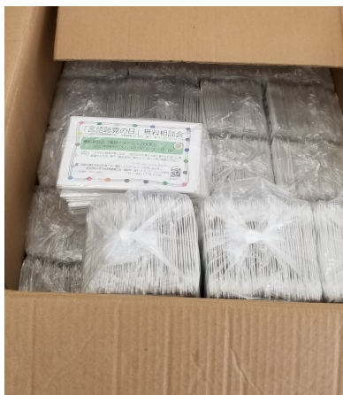
<チラシとチラシ入りマスク>